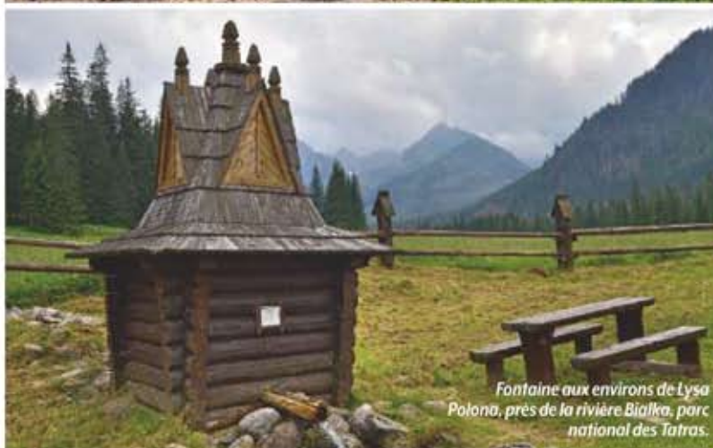
Fontaine aux environs de Lysa Polona, près de la rivière Bialka, parc national des Tatras.