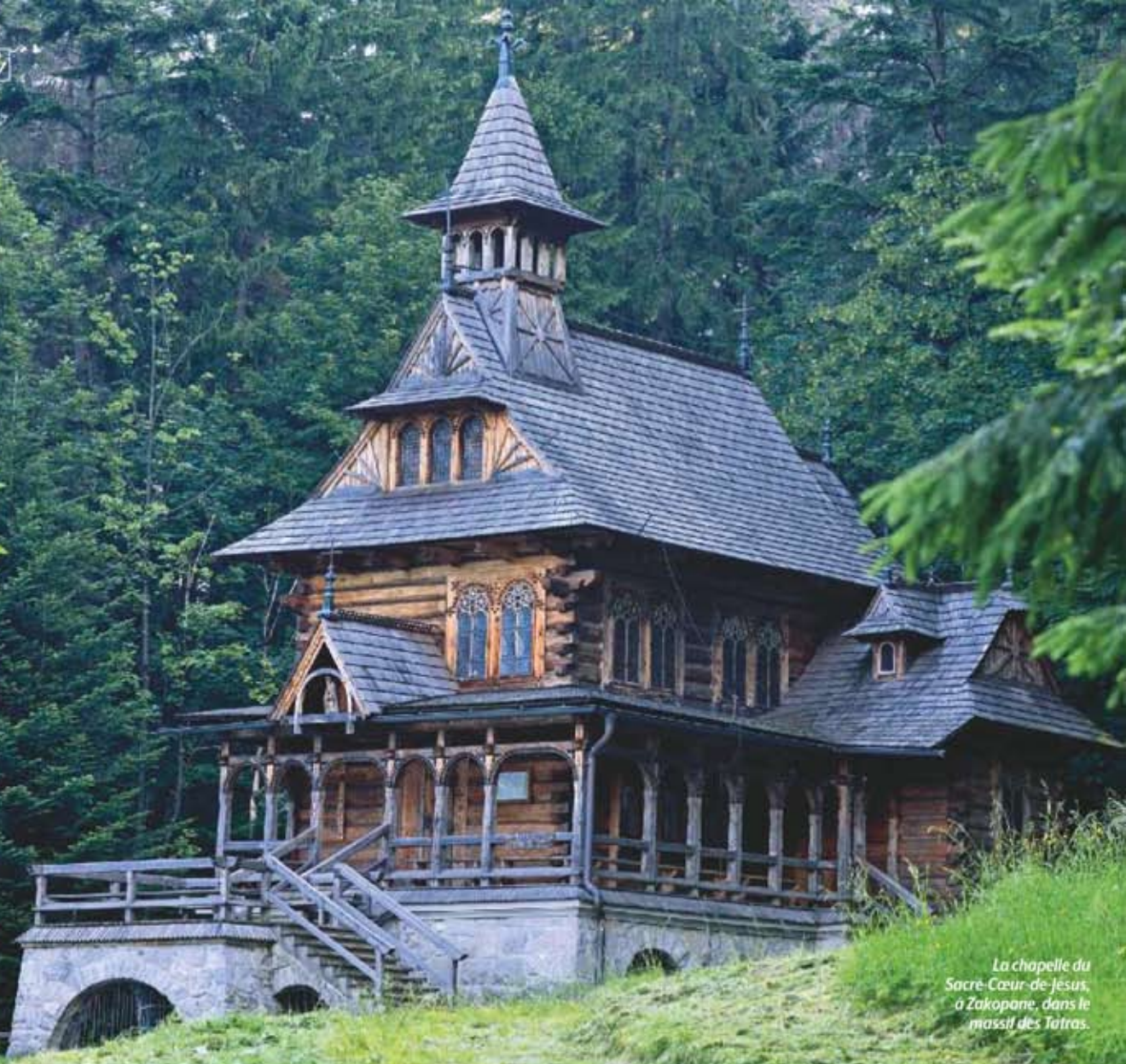
La chapelle du Sacré-Cœur de Jésus, à Zakopane, dans le massif des Tatras.