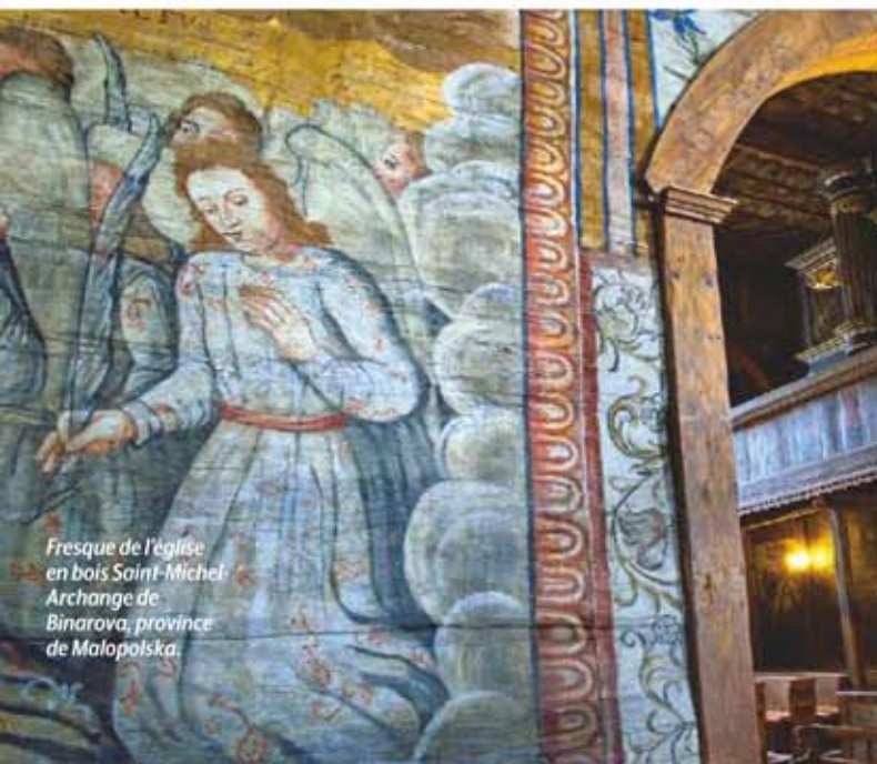
Fresque de l'église en bois Saint-Michel Archange de Binarowa, province de Malopolska.