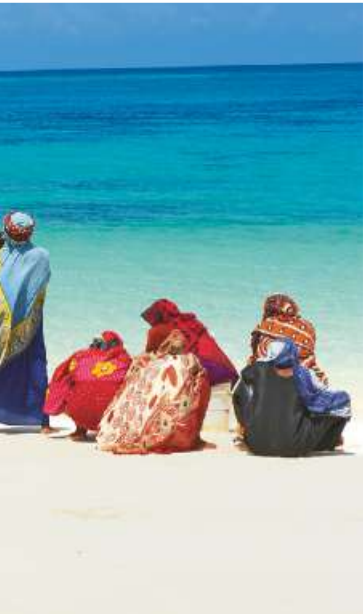
KIWENGWA BEACH RESORT

Ceux qui préfèrent voyager en individuel trouveront des pensions au confort plus spartiate autour de 30 € la nuit (Surfescape Village ou Miramont Retreat). Un peu plus cher (60 € env.), plus au sud, et toujours à une heure de l'aéroport : le Melik's, une maison blanche à arcades sur la jolie plage de Jambiani (six chambres avec vue sur la mer) ou le Ndamé Beach Lodge et ses charmants bungalows aux toits de palme sur la plage animée de Paje. Notre conseil : louer une petite voiture à l'aéroport (à partir de 31 € par jour chez Hertz) pour visiter l'île de fond en comble.