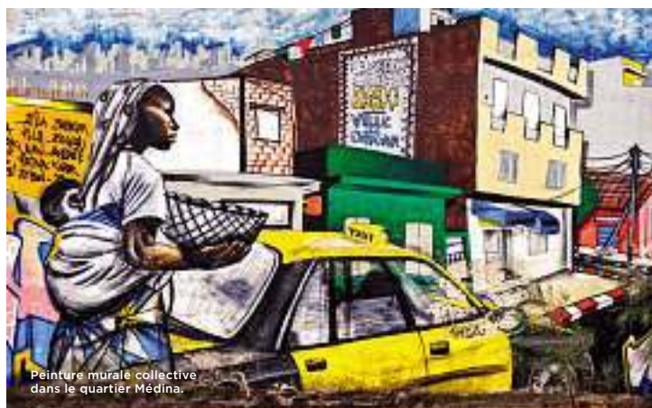
Peinture murale collective dans le quartier Médina.

Bazoff, 10, rue Sicap. Sur réservation au 33-864-92-92.