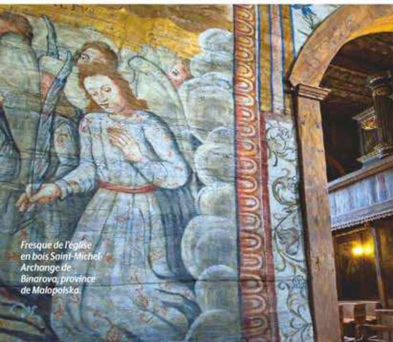
Fresque de l'église en bois Saint-Michel Archange de Binarowa, province de Malopolska.