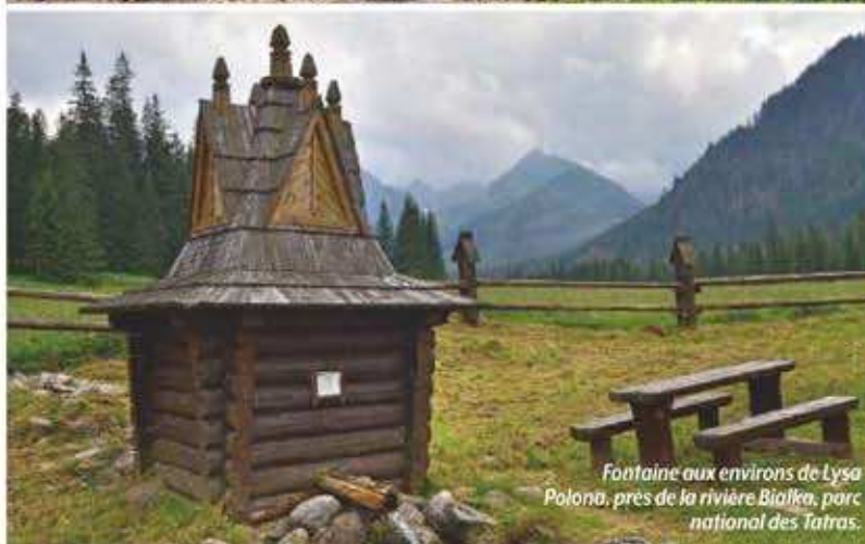
Fontaine aux environs de Lysa Polona, près de la rivière Bialka, parc national des Tatras.