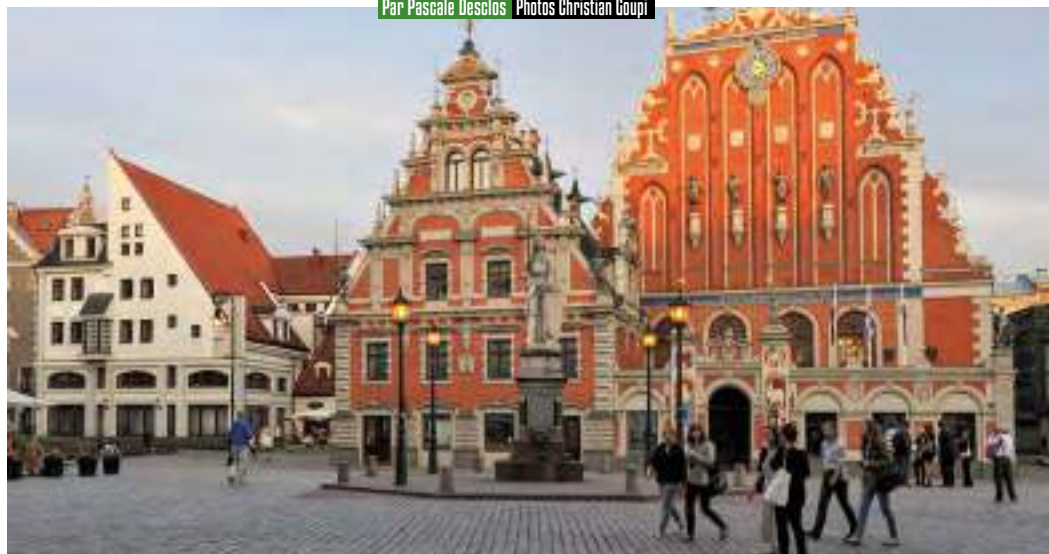
C'est à pied ou à vélo que l'on découvre les places, les ruelles et les jardins de Riga. Balade de la place de l'Hôtel de ville, ornée de maisons de briques à frontons au canal qui enserre la vieille ville dans un anneau de verdure.

Par Pascale Desclos