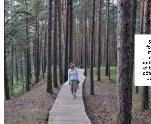
Sentiers forestiers, maisons en bois traditionnelles et baignade côté plage à Jurmala.