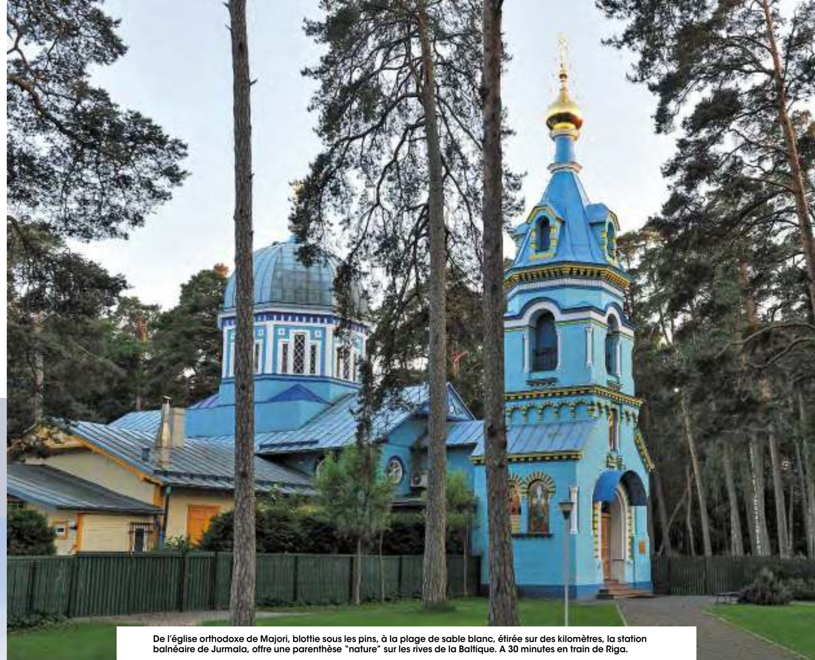
De l'église orthodoxe de Majori, blottie sous les pins, à la plage de sable blanc, étirée sur des kilomètres, la station balnéaire de Jurmala, offre une parenthèse "nature" sur les rives de la Baltique. A 30 minutes en train de Riga.