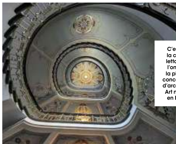
C'est dans la capitale lettone que l'on trouve la plus forte concentration d'architecture Art nouveau en Europe.