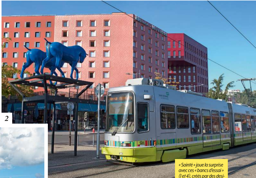
« Sainté » joue la surprise avec ces « bancs d'essai » (1 et 4), créés par des designers et des entreprises locales, comme la Tôlerie Forézienne, ou encore ces Chevaux Bleus, d'Assan Smati (2), à deux pas de l'emblématique gare de Châteaureux (3).