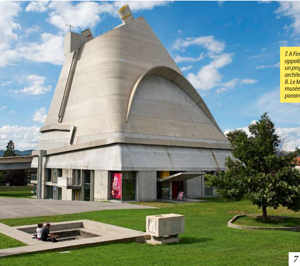
7. A Firminy, l'église Saint-Pierre, appelée « église Le Corbusier », un projet inabouti du grand architecte, achevé en 2006. 8. Le MAMC+ est l'un des premiers musées d'art moderne et contemporain créé en 1987 hors de Paris.